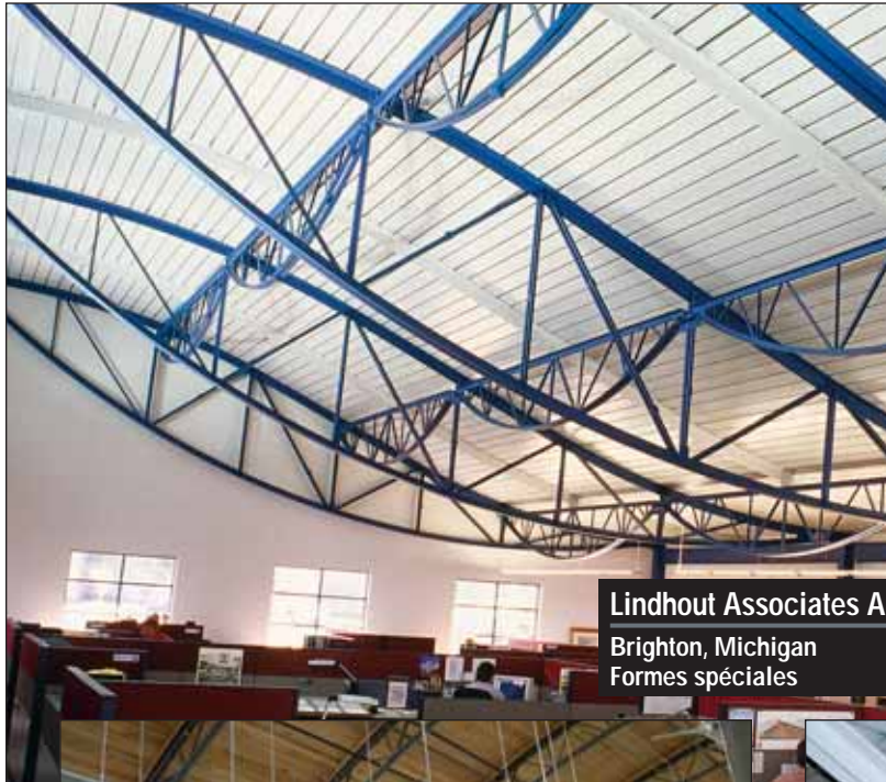
Lindhout Associates Architects Brighton, Michigan Formes spéciales