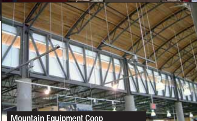
Mountain Equipment Coop Montréal, Québec Bâtiment vert