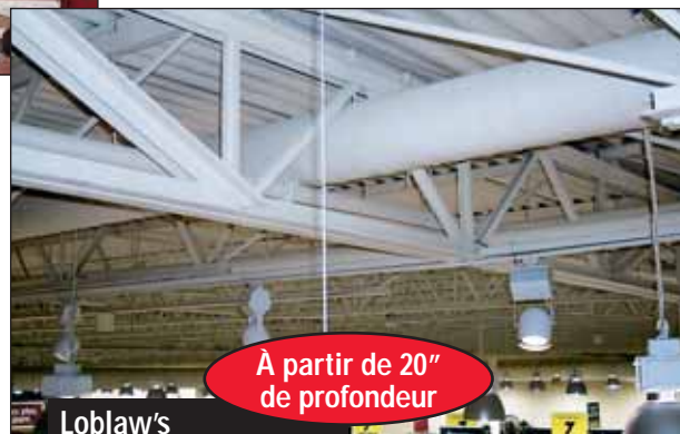
Loblaw's Saint-Georges, Québec Fermes ajourées