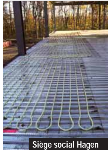
Siège social Hagen Baie d'Urfé, Québec Plancher radiant